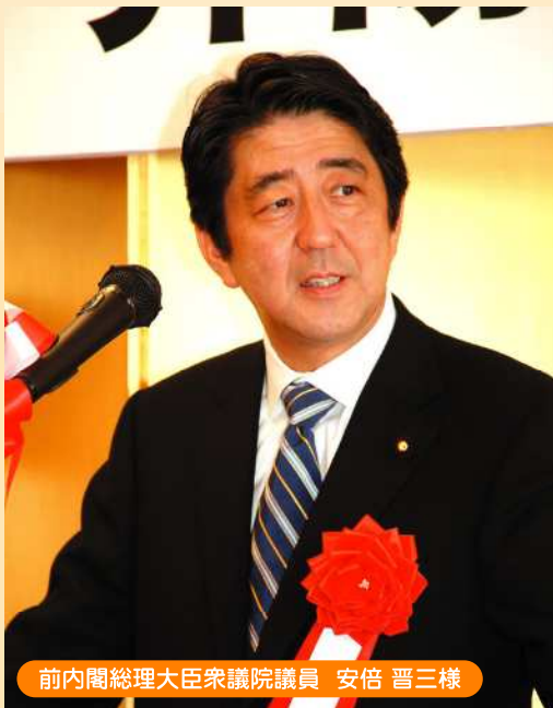
前内閣総理大臣衆議院議員 安倍 晋三様