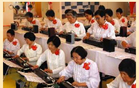
▲「長府愛好会」による大正琴