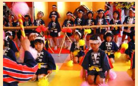
▲「弟子松保育園」園児による歌や踊り

平成20年7月12日、社会福祉法人さわやか会では、初となる住宅型有料老人ホーム「さわやか昇陽式番館」の竣工式典が行われました。前内閣総理大臣で衆議院議員の安倍晋三様をはじめ、多くの来賓の方々にご参加頂きました。式典では、安倍様より祝辞も頂き、参加された入居者の方々も大感激でした。